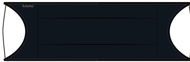
Face extérieure (Polyester+Spandex)